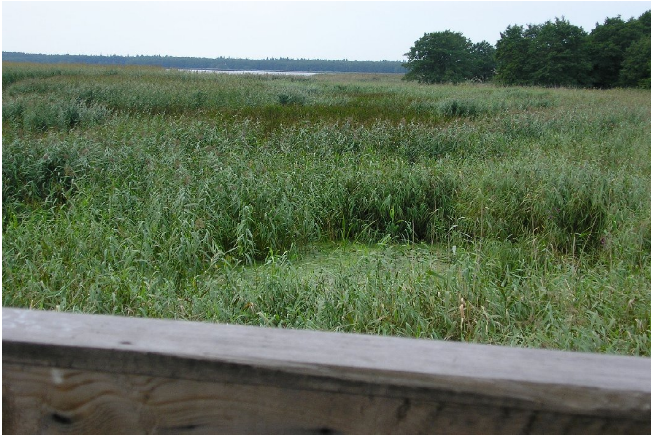
Сплошное поле тростника у корневой части Куршской косы