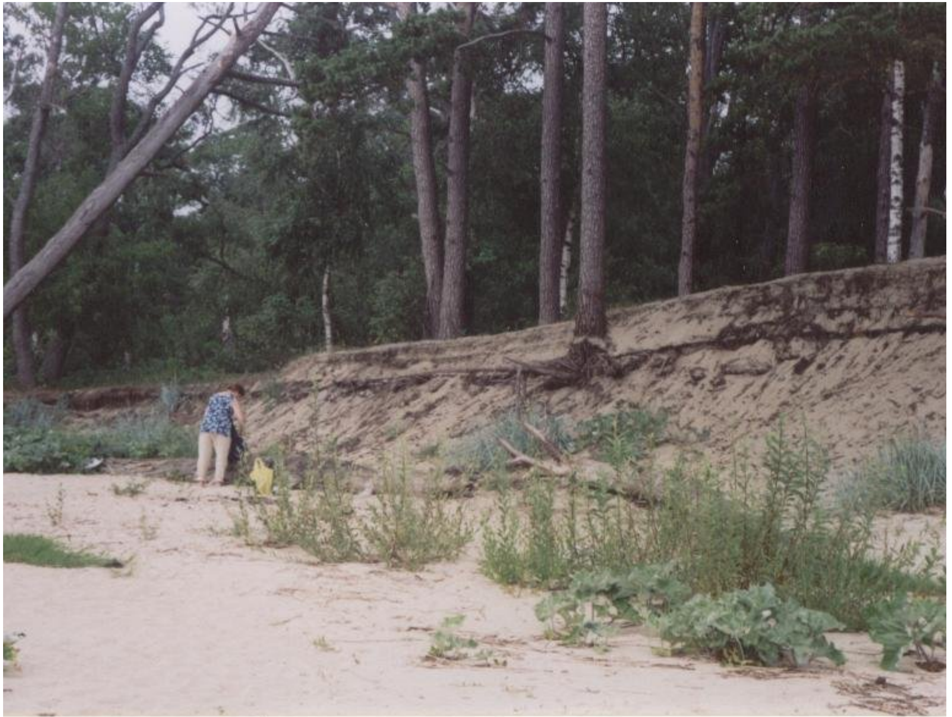
Размыв берега севернее пос. Морское