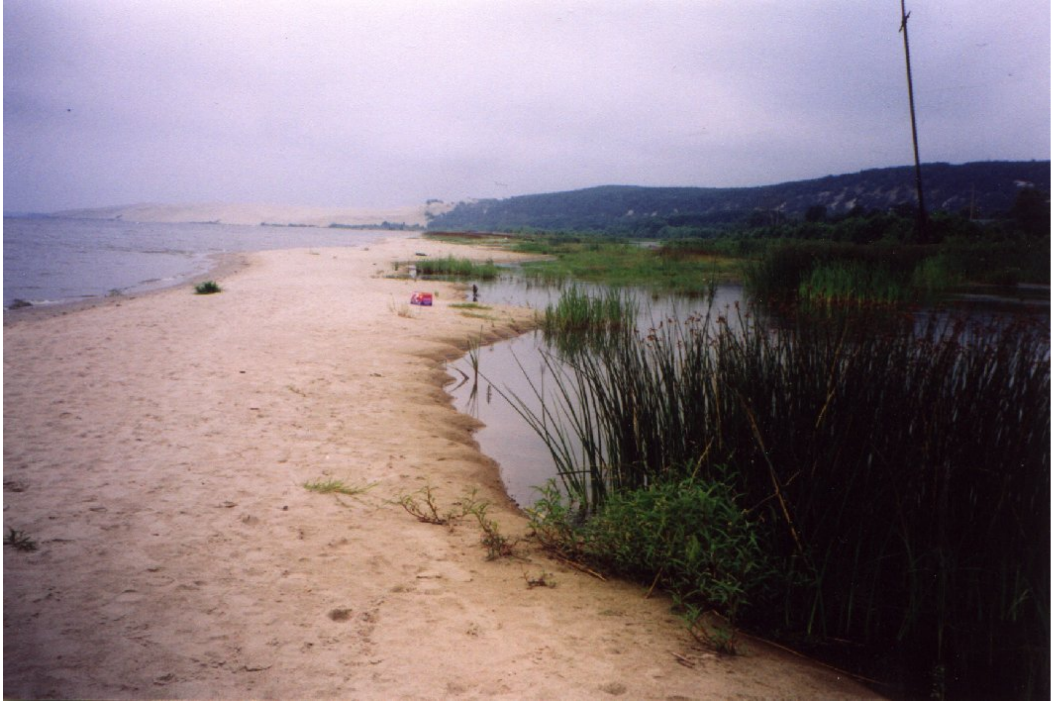
Остатки искусственной пересыпи у пос. Морское