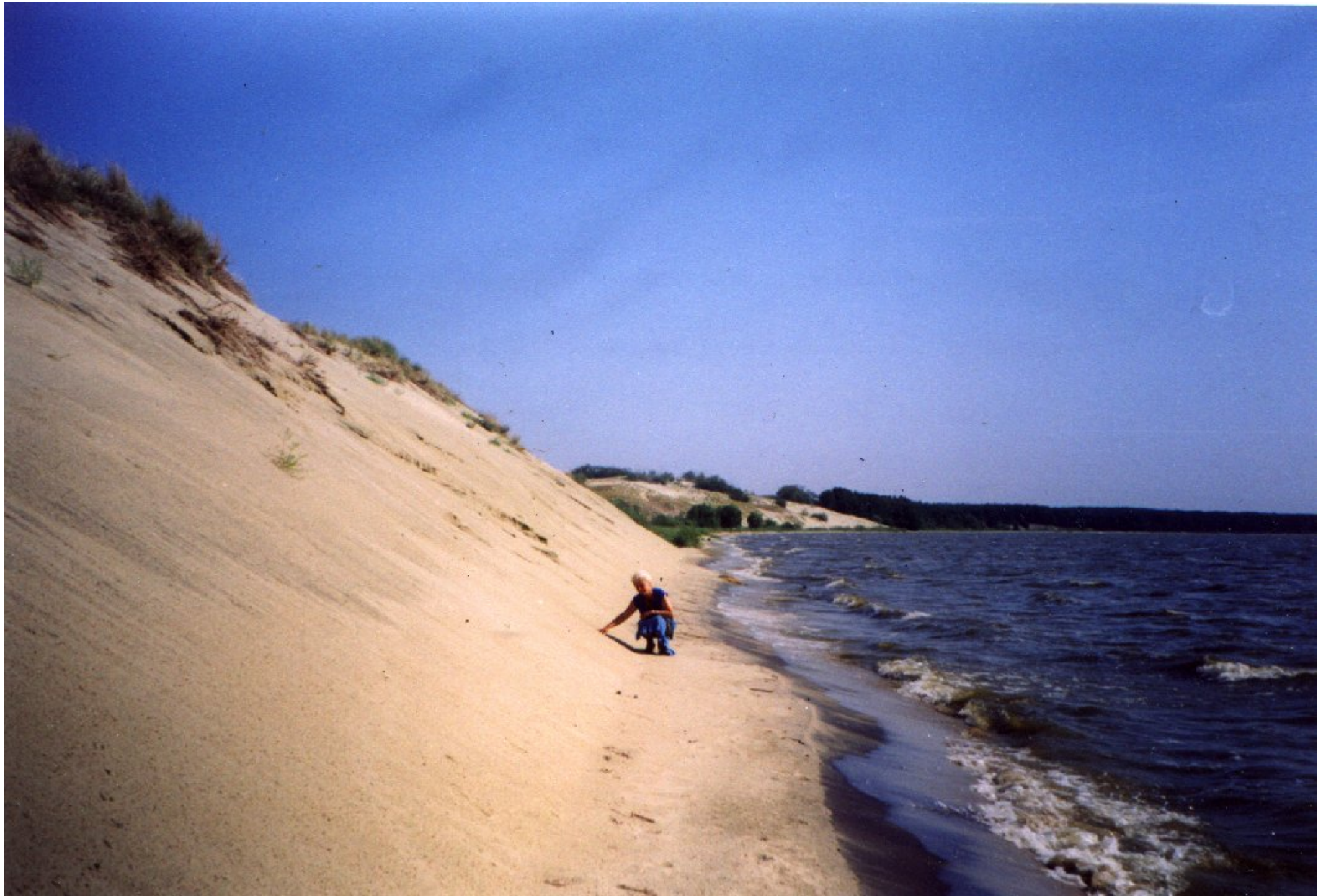
Активная (незалесенная) дюна непосредственно у уреза залива