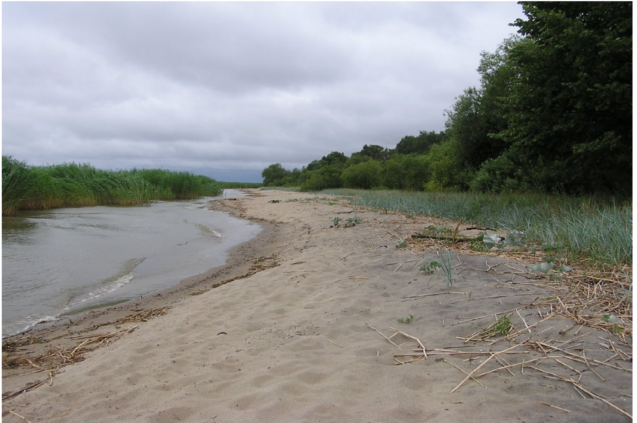
Активная аккумуляция песчано-ракушечного материала у м. Рыбачий