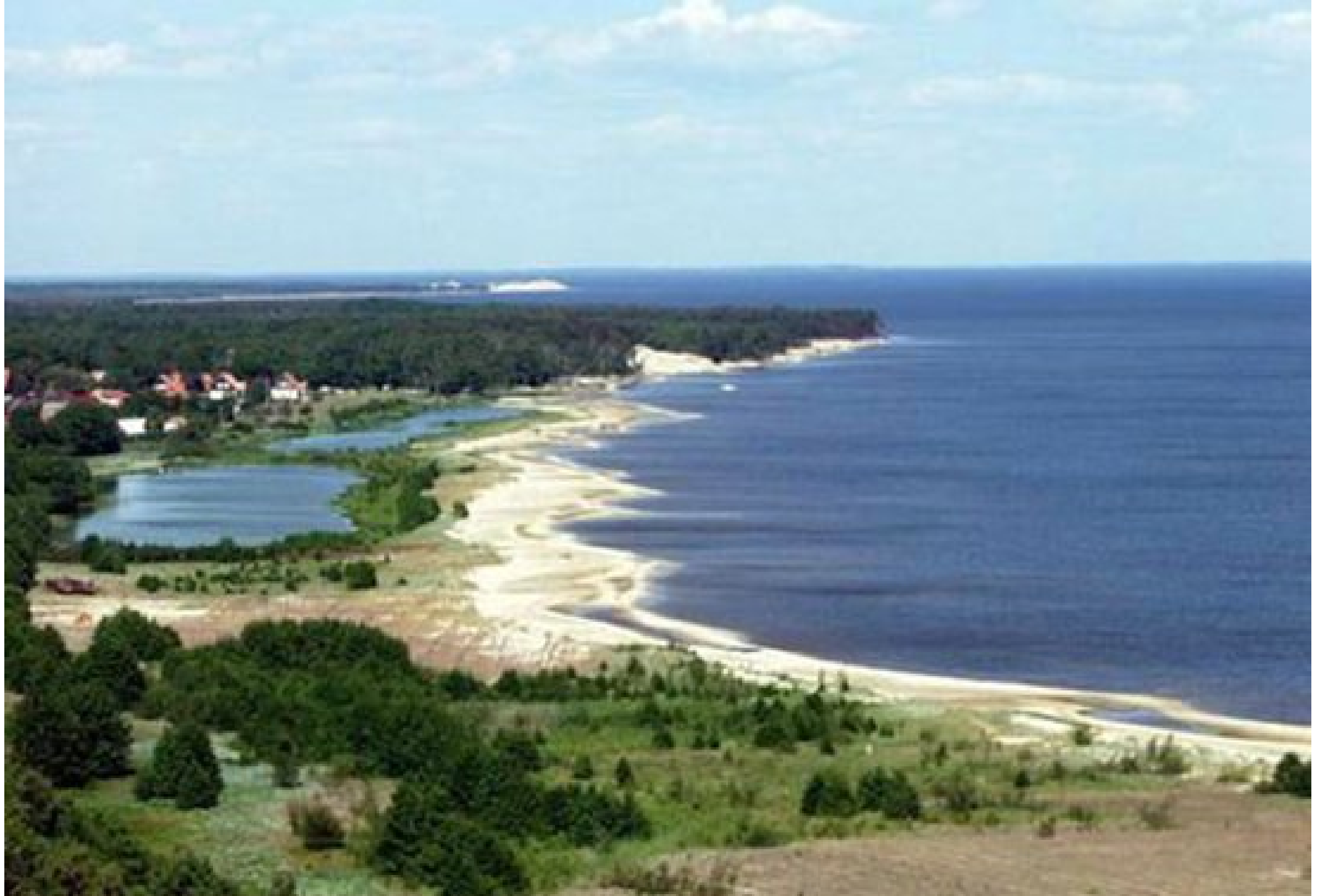
Общий вид искусственной пересыпи у пос. Морское в 2004-2005 гг.