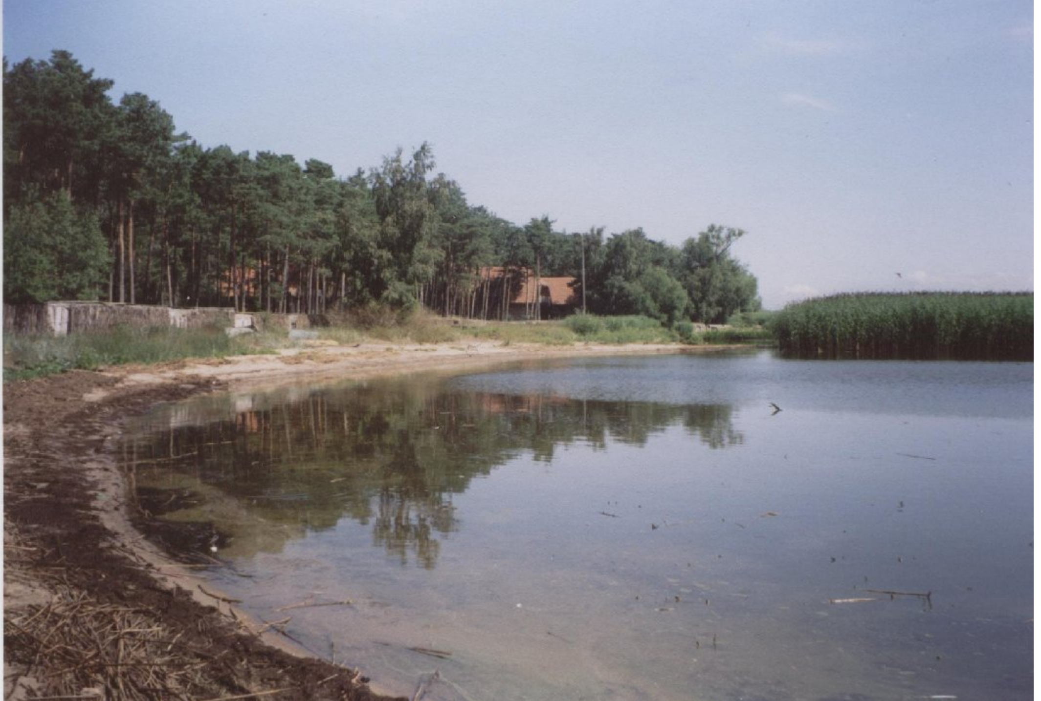
В разрыве полосы тростника (справа) – размыв берега и волноотбойная стенка