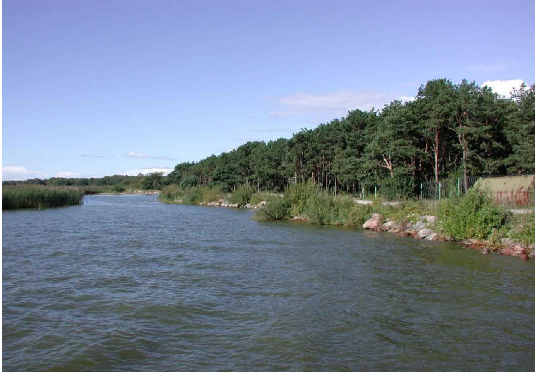
Берегоукрепительные сооружения у музея