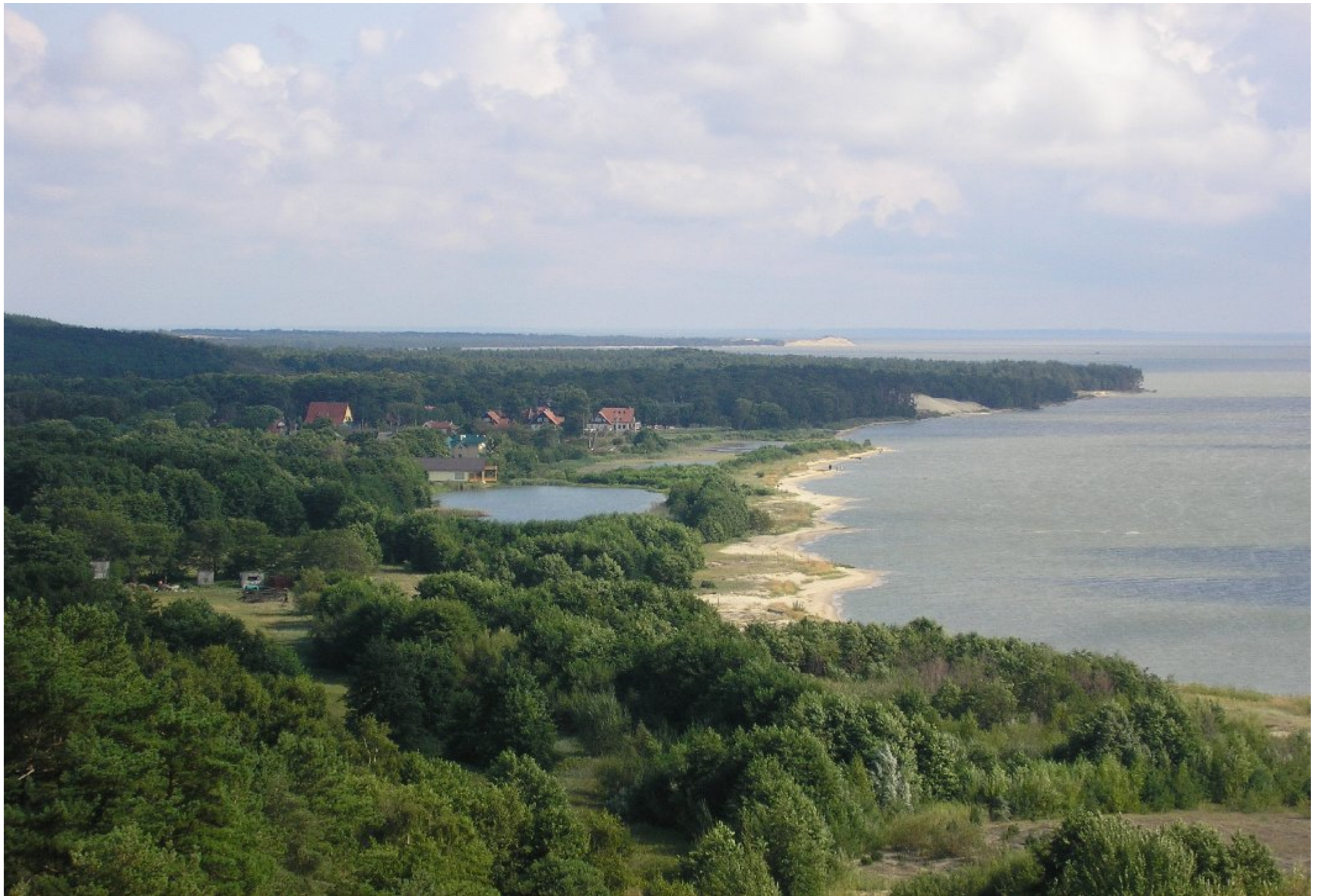
Общий вид искусственной пересыпи у пос. Морское в 2006-2007 гг.